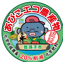
認証シールデザイン

現在、我孫子市ではあびこエコ農産物に貼ってある「あびこエコ農産物認証シール」（右参照）を20枚集めて応募すると、抽選でエコ農産物をプレゼントする「あびこエコ農産物応援キャンペーン」を開催中！この機会に、あびこエコ農産物をたくさん食べて、地元の農家さんを応援しながら、キャンペーンにも応募してみましょう！